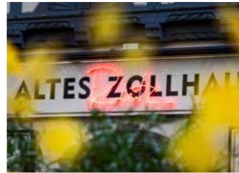
Früher Zollstation, jetzt Spitzenrestaurant

Kleine Gruppen, große Abstände Beim Finale galt „2G plus“. Nur wer negativ getestet war, durfte mitverkosten. Zwischen den Juroren blieb jeweils ein Platz frei