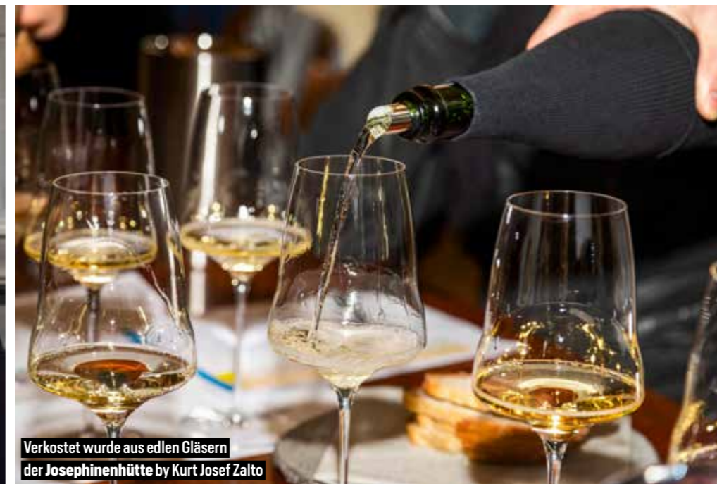
Verkostet wurde aus edlen Gläsern der Josephinenhütte by Kurt Josef Zalto