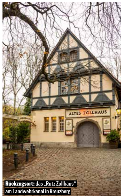
Rückzugsort: das „Rutz Zollhaus“ am Landwehrkanal in Kreuzberg